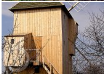
Současné fotografie - exteriér