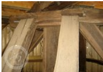
Současné fotografie - technologické vybavení