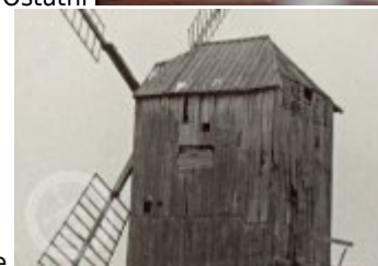
Historické fotografie a pohlednice