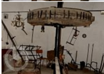
Současné fotografie - technologické vybavení