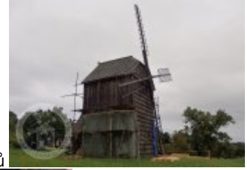
Současné fotografie - exteriér - detaily stavebních prvků