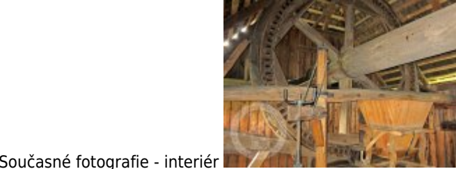
Současné fotografie - interiér