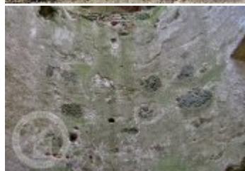
Současné fotografie - exteriér - detaily stavebních prvků