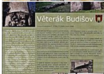
Současné fotografie - exteriér