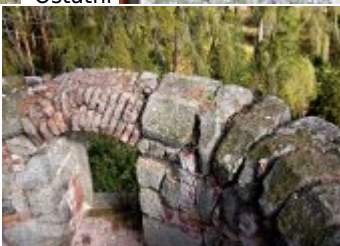
Současné fotografie - objekt