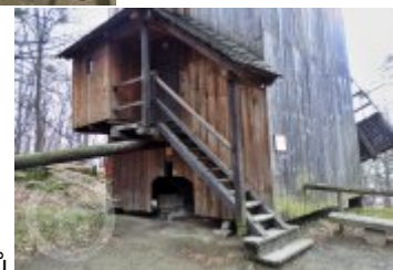
Současné fotografie - exteriér - detaily stavebních prvků