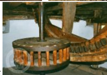
fotografie - technologické vybavení