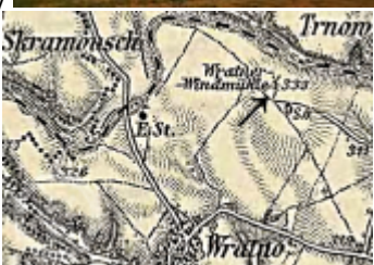
Plány - stavební a konstrukční