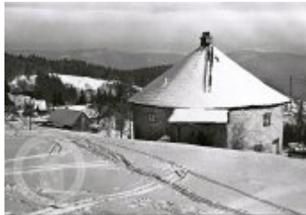
Současné fotografie - exteriér