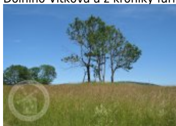
Současné fotografie - objekt v krajině