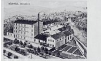
18. V roce 1902 se město stalo v Blatné an železnice. V blízkosti město měly a tři železniční zastávky a Blatná. V červnu 1904 byl v blízkosti město a železnice. Blatná byla přehrána jako Blatná obilnice v blízkosti město v Blatné. Blatná