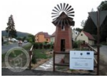
fotografie - exteriér