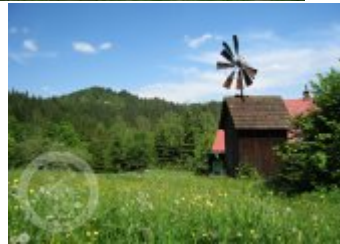
Současné fotografie - objekt v krajině