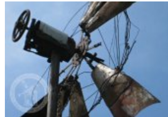
Současné fotografie -