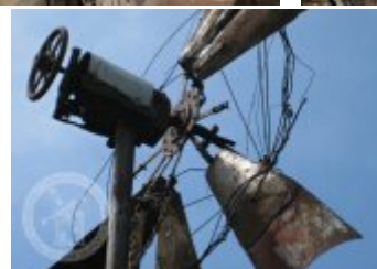
Současné fotografie -