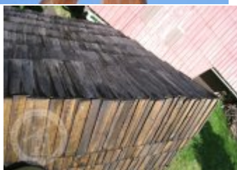
exteriér - detaily stavebních prvků