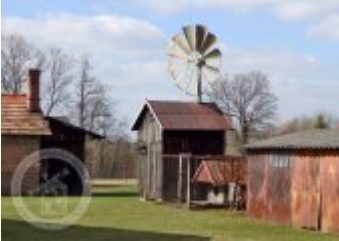
Současné fotografie - technologické vybavení